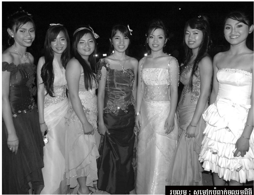
រូបលម្អ : សម្លៀកបំពាក់ចូលរួមពិធីមង្គលការកែច្នៃយ៉ាងស្អាតសមរម្យ