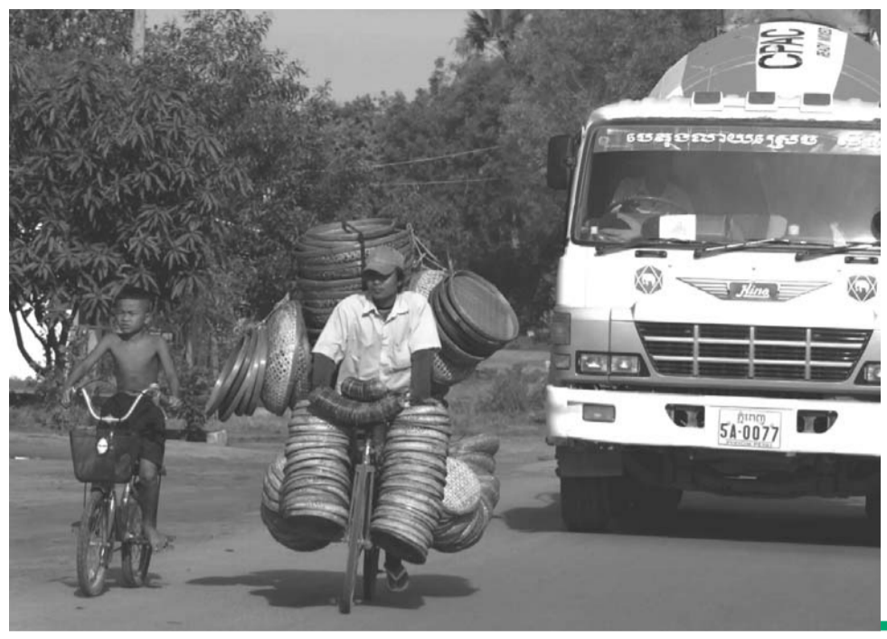
ការអនុវត្តន៍ ច្បាប់ ចរាចរណ៍នៅ តាមដងផ្លូវ មិនទាន់បាន ទូលំទូលាយ នៅឡើយ។ ប្រជាពលរដ្ឋ ខ្មែរត្រូវការ ស្វែងយល់ បន្ថែមពីច្បាប់ នេះដើម្បី សុវត្ថិភាពខ្លួន