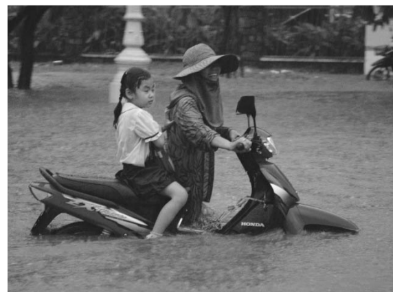
ឆ្នាំនេះពេលភ្លៀងធ្លាក់ ធ្វើឱ្យផ្លូវនៅវាលជម្រកំពុងពេញត្រូវ លិចទឹក ប្រជាពលរដ្ឋត្រូវពិបាកធ្វើដំណើរយ៉ាងខ្លាំង