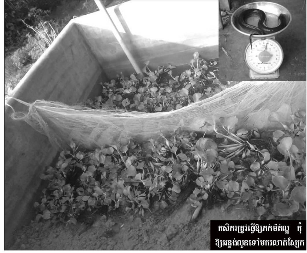
កសិករត្រូវធ្វើឱ្យរាក់ម៉ត់ល្អ កុំឱ្យអន្ទង់លូតទៅមករលាត់ស្បែក

ការរៀបចំកន្លែង កសិករអាចចិញ្ចឹមអន្ទង់នៅក្នុងអាងស៊ីម៉ង់ត៍ ឬពាង ក្រាសកៅស៊ូនៅបាត ។ គាត់អាចសង់អាងនៅទីស្រឡះ មានដើមឈើ មានម្លប់ខ្លះៗ ស្លាប់ស្ងាត់ និងគ្មានសំឡេងរំខាន ។ សង់អាងរួច គាត់ត្រូវដាក់ទឹកកំបោរត្រាំពីពា ទៅដៃថ្ងៃ ដើម្បីកាត់ក្លិនស៊ីម៉ង់ត៍ ។ ក្នុងទឹកមួយម៉ែត្រគឺប ត្រូវដាក់កំបោរកន្លះគីឡូ ។ ពេលបូមទឹកចេញ ត្រូវលាងអាងដាក់ហាលថ្ងៃ ។ ជម្រកក្នុងអាងត្រូវរៀបចំជា ៤ស្រទាប់ : ស្រទាប់ទី១ ដាក់ដីភក់បាតបឹងឬដីដីបូកវែងឱ្យម៉ត់ កម្រាស់ ១តិក (១០សង់ទីម៉ែត្រ) ។ ស្រទាប់ទី២ កម្រាស់ ១តិក ដាក់លាមកមាត់ និងលាមកជ្រូកស្លុតលាយបញ្ចូលគ្នាស្មើ ។ ស្រទាប់ទី៣ ក៏កម្រាស់ ១តិកដែរ ដាក់ដើមចេកហាលឱ្យស្ងួតឱ្យអស់ជាតិជីវ ។ រីឯស្រទាប់ទី៤ សូមដាក់ដីដីបូក ឬក៏ភក់បាតបឹងវិញ ។ ស្រទាប់នេះ ត្រូវតែធ្វើឱ្យទេរទាបម្នាង ។ កសិករត្រូវបូមទឹកដាក់ស្រទាប់ខាងលើ រួចរកកំប្លោកតូចៗដាក់លើទឹក ។ បើទឹកស្អុយត្រូវផ្លាស់ចេញ ។ ការដាក់ពូជ និងឱ្យចំណី កសិកររកពូជកូនអន្ទង់ដែលជាប់លប ឬទ្រូ ទើបបានល្អ ។ ក្នុងអាងមួយម៉ែត្រការ៉េ គឺត្រូវដាក់កូនអន្ទង់ពី៤០ ទៅ៦០ក្បាល ដាច់ខាតត្រូវឱ្យពូជវាមានទំហំប៉ុនៗគ្នា ដើម្បីកុំឱ្យពូជវាស៊ីគ្នា ។ កសិករត្រូវ