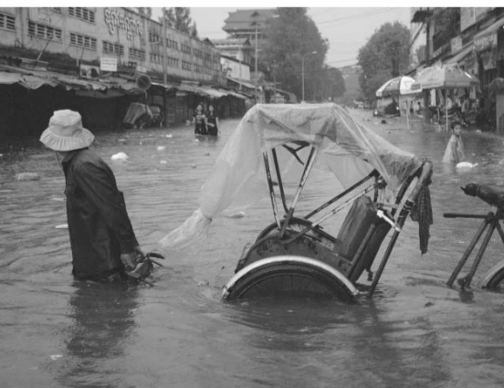
លោកតាអូសស៊ីក្លូរបស់គាត់កណ្តាលទឹកដោយសារ បណ្តាញលូមានភាពតូចចង្អៀត ធ្វើឱ្យទឹកហូរមិនទាន់