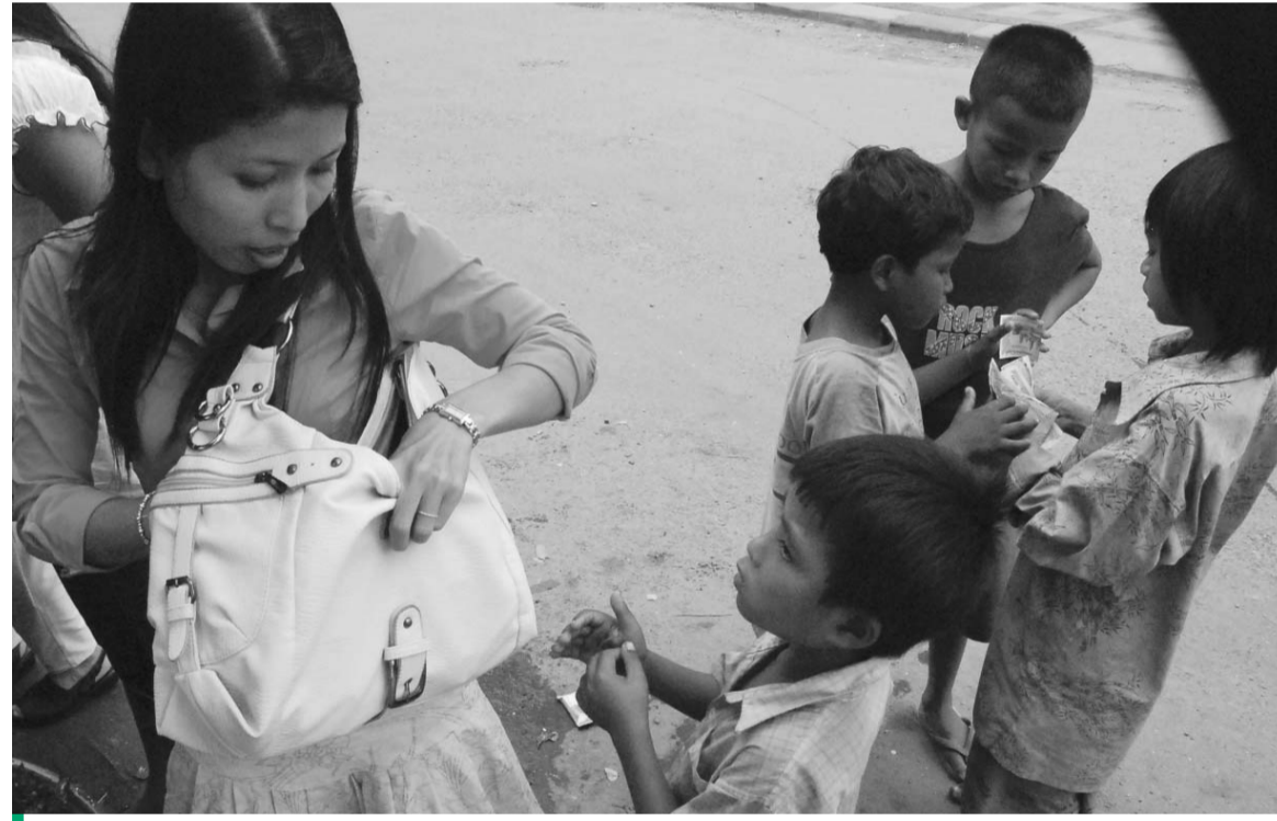
ប្រទេសកម្ពុជានៅតែមានកុមារកំប្រា និងក្រីក្រជាច្រើន ដែលពួកគេខ្លះមេឡាពាយចិញ្ចឹមជីវិត និងទទួលការរៀន សូត្រ តើស្ថាប័ន អង្គការ ឬនរណាម្នាក់អាចមានគោលនយោបាយ ឬផ្តល់នូវសេវាជាមូលដ្ឋានដល់ពួកគេបាន?