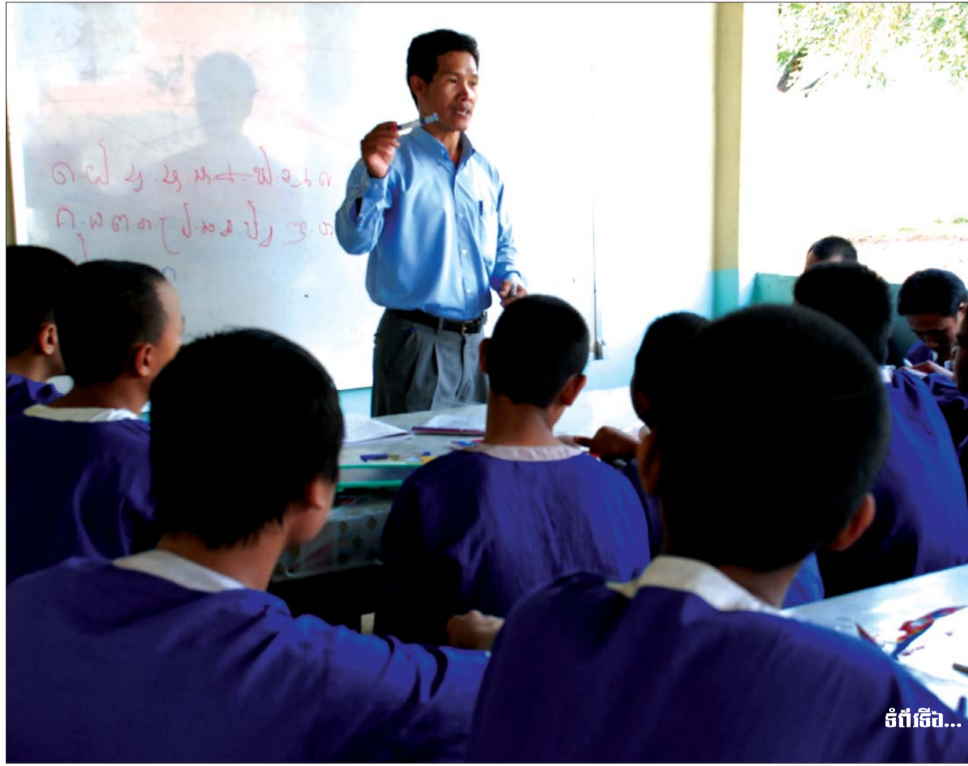
ទំព័រទី៧...