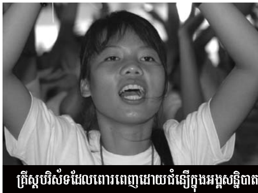
គ្រីស្ទបរិស័ទដែលពោរពេញដោយជំនឿក្នុងអង្គសន្និបាត