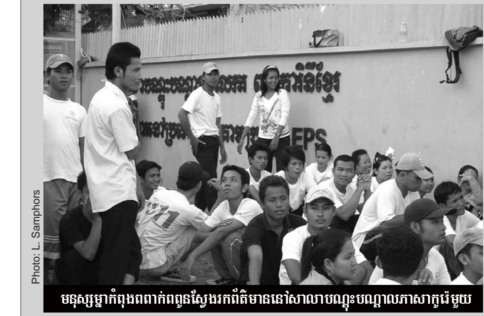
មនុស្សម្នាក់កំពុងពាក់ព័ន្ធនឹងការណែនាំពីការងារនៅសាលាបណ្តុះបណ្តាលភាសាកូរ៉េមួយ

និងការបញ្ជូនឈ្មោះក្នុងបញ្ជីអ្នកស្វែងរកការងារធ្វើដើម្បីឱ្យនិយោជក ឬក្រុមហ៊ុន កូរ៉េជ្រើសរើសជាមុនក្រោយនោះឡើយ។ អាស្រ័យដ្ឋានពេលមកខាងលើនេះ សូមបងប្អូនពលករដែលមានបំណងទៅធ្វើ ការនៅសាធារណរដ្ឋកូរ៉េ មិនត្រូវឃើញតាមពាក្យធានាអះអាងរបស់ជនណាម្នាក់ ក្រុមហ៊ុន ឬសាលាណាមួយឱ្យសោះ ពីព្រោះថាមានតែអ្នកដែលបានប្រឡងជាប់ តេស្តភាសាកូរ៉េ មិនមានបញ្ហាសុខភាព ព្រមទាំងបានដាក់ពាក្យសុំរកការងារធ្វើ នៅក្រុមប្រឹក្សាភិបាលបណ្តុះបណ្តាល និងបញ្ជូនពលករទៅបរទេសតែប៉ុណ្ណោះ ដែលត្រូវបានគេបញ្ជូនឈ្មោះចូលទៅក្នុងប្រព័ន្ធនិវេនសម្រាប់អ្នកស្វែងរកការងារ ធ្វើរបស់អង្គការដែលមានព័ត៌មានទាំងអស់ ដែលប្រព័ន្ធនេះត្រូវបញ្ជូនមកដោយ សារអេឡិចត្រូនិកដែលរៀបចំ និងដំឡើងដោយភាគីកូរ៉េ។ ហេតុដូច្នេះនេះអ្នកប្រព្រឹត្តិអំពើអាក្រក់ នឹងត្រូវទទួលទោសចំពោះមុខច្បាប់។ សម្រាប់ព័ត៌មានបន្ថែម សូមបងប្អូនប្រជាពលរដ្ឋអញ្ជើញទៅធ្វើការទំនាក់ទំនង ជាមួយក្រុមប្រឹក្សាបណ្តុះបណ្តាល និងបញ្ជូនពលករទៅបរទេសដែលមានទីតាំង ស្ថិតក្នុងវិទ្យាស្ថានជាតិពហុបច្ចេកទេសកម្ពុជា នៅភូមិស្រែរាជ្យ សង្កាត់សំរោង ក្រោម ខណ្ឌដង្កោ រាជធានីភ្នំពេញ ឬបងប្អូនអាចទំនាក់ទំនងមកកាន់ទូរស័ព្ទ លេខ : ០២៣ ៣៥៥ ២១៤ / ០១១ ៣៨៣ ៧៣៥ ឬ ០១៦ ៣៧២ ៤៦៦ នៅរៀងរាល់ម៉ោង និងថ្ងៃធ្វើការ។ យោងតាមលិខិតអង្គការអភិវឌ្ឍន៍ធនធានមនុស្សនៃប្រទេសកូរ៉េចុះថ្ងៃទី៨ ខែ មិថុនា ឆ្នាំ២០០៧ បេក្ខជន-នារី ដែលបានប្រឡងជាប់តេស្តភាសាកូរ៉េលើក ទី១ ហើយបានទទួលពិន្ទុសរុបលើស ១២០ពិន្ទុ មានចំនួន ៣៩៦នាក់ និង ពិន្ទុសរុប ចន្លោះ៦០-១១៩ពិន្ទុ មានចំនួន ១៥០៤នាក់ ក្នុងចំណោម បេក្ខជន-នារី ដែលមានសិទ្ធិប្រឡងទាំងអស់ចំនួន ២ ៤៩៧នាក់។