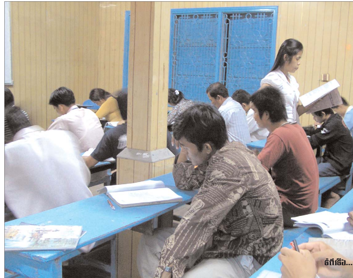
ទំព័រទី១០...