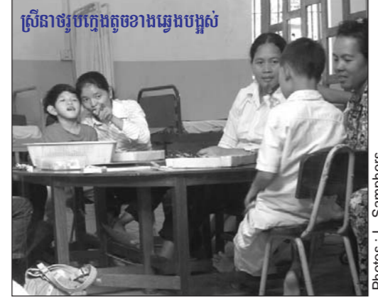
ស្រីនាថរូបក្មេងតូចខាងឆ្វេងបង្អស់

ដំណឹងពីមជ្ឈមណ្ឌលសុខភាពផ្លូវចិត្តកុមារនេះ ខ្ញុំក៏បាននាំកូនមកកាន់ទីនេះ ហើយចាប់តាំងតែពីពេលនោះមក កូនខ្ញុំនាងបានគ្រាន់ជាងមុន ។ អ្នកស្រីគូសបញ្ជាក់ថា កាលពីមុននាងមិនអាចដើរ