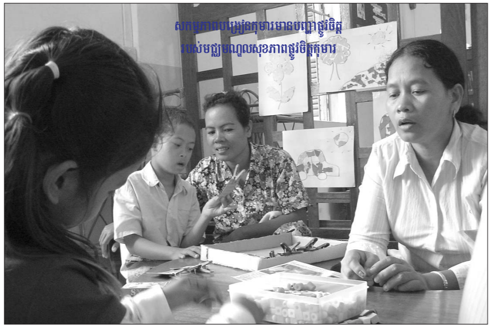
សាកលវិទ្យាល័យអង្គការមានបញ្ហាផ្លូវចិត្ត របស់មជ្ឈមណ្ឌលសុខភាពផ្លូវចិត្តកុមារ

អង្គការកំពុងធ្វើសកម្មភាព មាន ៥ផ្នែកសំខាន់ៗ : កម្មវិធីអភិវឌ្ឍន៍សហគមន៍ចម្រុះ កម្មវិធីអភិវឌ្ឍន៍វិស័យសុខភាព កម្មវិធីអភិវឌ្ឍន៍យុវជន ការអប់រំ និងការគ្រប់គ្រងគ្រោះមហន្តរាយ ។ កម្មវិធីមួយកំពុងអនុវត្តនៅក្នុងមន្ទីរពេទ្យបង្អែកជ័យជម្នះស្រុកតាខ្មៅ ខេត្តកណ្តាលនោះ ជាកម្មវិធីរបស់មជ្ឈមណ្ឌលសុខភាព ផ្លូវចិត្តកុមារ ហៅកាត់ CCAMH ។ នេះជាកម្មវិធីថ្នាក់ជាតិដើម្បីជួយដល់កុមារបញ្ហាអន់ខ្សោយ កុមារមានបញ្ហាសុខភាពយឺតយ៉ាវ និងកុមារដែលមានបញ្ហាផ្លូវចិត្ត ។ កម្មវិធីនេះបានយកចិត្តទុកដាក់ដើម្បីពង្រឹងស្ថាប័នកសាងសមត្ថភាពបុគ្គលិក ពង្រឹងការងារសហគមន៍