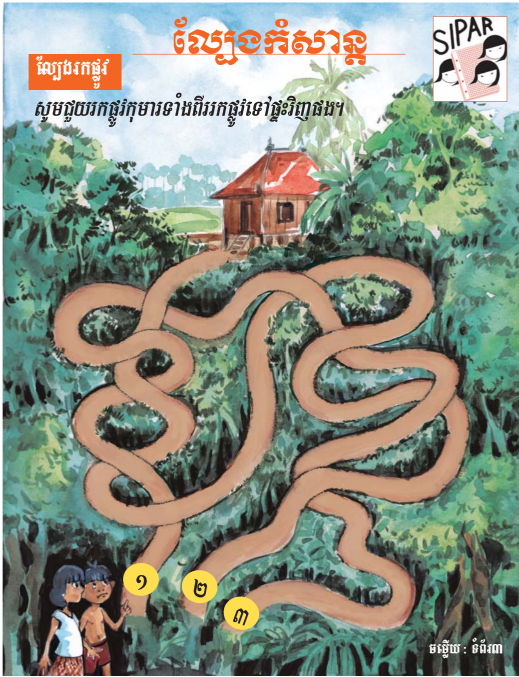
សូមថ្លែងអំណរគុណដល់អង្គការស៊ីប៉ាដែលជួយឧបត្ថម្ភទំព័រនេះ។ អង្គការស៊ីប៉ា : ប្រអប់សំបុត្រ ៣១ ផ្ទះលេខ៩ ផ្លូវ២១ រាជធានីភ្នំពេញ កម្ពុជា ឬទូរស័ព្ទ : ០២៣ ២១៦ ០០១។