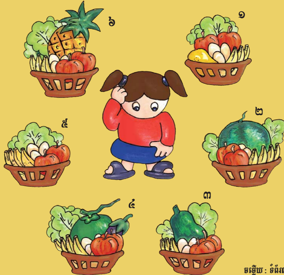
មន្ទីរ៖ ទំព័រ៣

សូមប្អូនជួយនាងតូចនេះ រកកន្លែករបស់នាងផង។ នៅក្នុងកន្លែករបស់នាងមាន ផ្លែចេក៤ ផ្លែប៉ោម២ ពងមាន់៣ និងសាលាដ ១ដុំ។