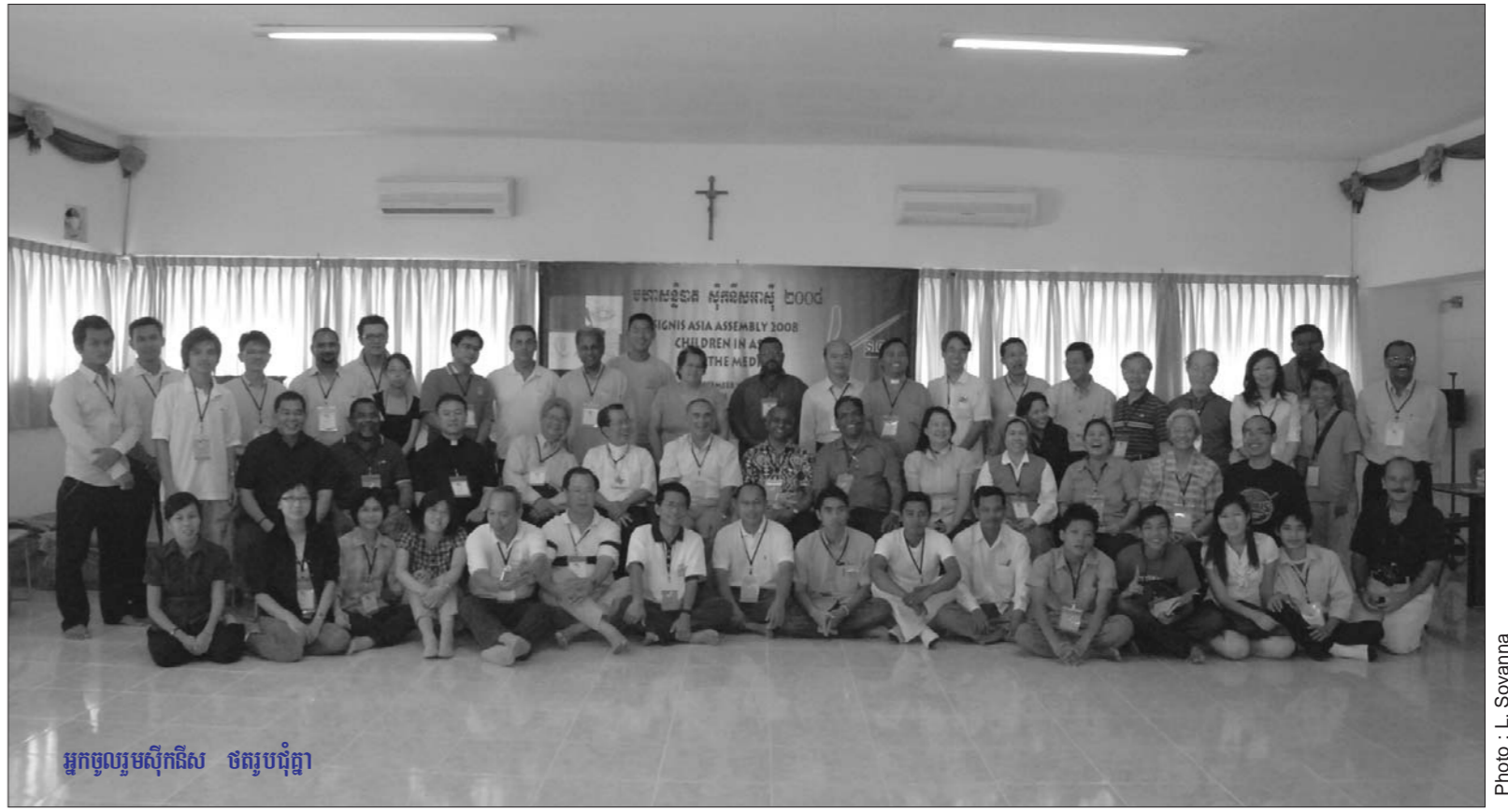
អ្នកចូលរួមស៊ីកនីស ចតុប្បជុំ

នៅក្នុងអង្គសន្និបាតនេះ គណៈកម្មការរៀបចំបានផ្តល់ម្ចាស់ដល់អ្នកដែលបានផលិតខ្សែអាត់យកអប់រំខ្លះៗ ពេលមួយនាទីស្តីពីកុមារនៅអាស៊ី និងប្រព័ន្ធផ្សព្វផ្សាយ។ ប្រទេសដែលទទួលបានម្ចាស់នេះ គឺស៊ីកនីសម៉ាឡេស៊ី ដែលផលិតខ្សែអប់រំខ្លះ ដែលមានចំណងជើងថា “ស៊ីបហើមែន” ដែលអប់រំកុមារកុំឱ្យយកគម្រាប់តាមស៊ីបហើមែន ដែលអាចហោះហើរពីអគារមួយទៅមួយអាគារមួយបាន។