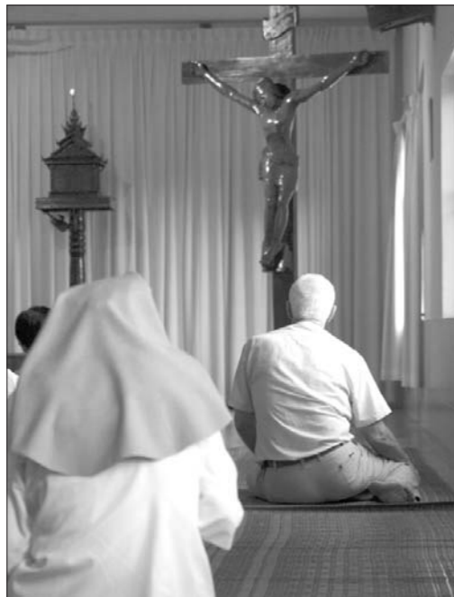
ក្នុងពិធីអភិបូជា ទោះបីលោកបូជាចារ្យបរទេសក៏លោកអង្គុយតាមទំនៀមទម្លាប់ជនជាតិខ្មែរដើម្បីថ្វាយការគោរពដល់អង្គព្រះគ្រីស្ទ (លើ)

ការកាត់ដំបូងដែលជាតំណាងព្រះកាយព្រះកាយព្រះគ្រីស្ទ និងផឹកស្រាទំពាំងបាយជូរ តំណាងព្រះលោហិតព្រះអង្គក្នុងពិធីអភិបូជាមួយកូនប្រជុំអប់រំពិសេសនៅព្រះសហគមន៍សន្តិវិសេស ភ្នំពេញ កាលពីថ្ងៃទី៨ ខែមីនា (ក្រោម)