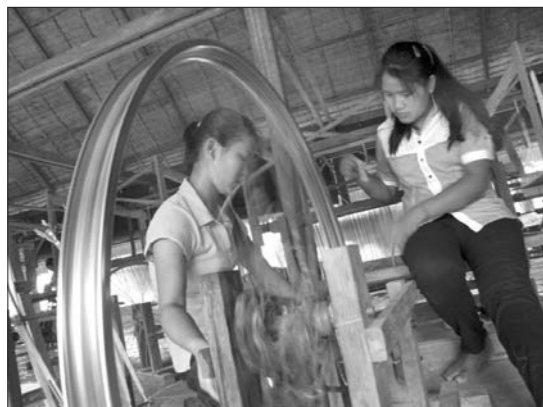
យុវនារីនៅព្រះសហគមន៍ចំការទៀង ជួយគ្នារៀនរៀនសូត្រទៅក្នុងគ្រល់ដើម្បីទុកត្បាញជាត្រណាត់នៅពេលក្រោយ។ សកម្មភាពនេះធ្វើឱ្យនិករដល់ការយកចិត្តទុកដាក់របស់ព្រះសហគមន៍ចំការទៀងអាជីបយុវនារីនៅជនបទ (ឆ្វេង)