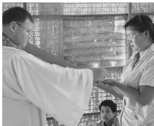
លោកបូជាចារ្យក្នុងសកម្មភាពចែកចំប៉ុងដែលតំណាងឱ្យព្រះ កាយព្រះគ្រីស្ទដល់គ្រីស្ទបរិស័ទដែលចូលរួមអភិបូជា

ការប្រៀបធៀប លើកតម្កើងព្រះ ជាម្ចាស់ និង សកម្មភាពការអាន អត្ថបទព្រះគម្ពីរ នៅក្នុងពិធីអភិបូជា របស់គ្រីស្ទបរិស័ទ ដែលពោរពេញ ដោយចម្រើន