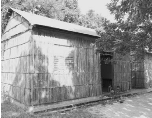
សាលាប្រជុំដំបូងនៃសហគមន៍តងនយ ដែលស្ថិតនៅស្រុក កណ្តាលស្ទឹង ខេត្តកណ្តាល ១៩ឆ្នាំម៉ែត្រ ពីភ្នំពេញ។

សហគមន៍តងនយ ចាប់ផ្តើមនៅពាក់កណ្តាល ទសវត្សរ៍ ៩០ តែហាក់ដូចជា ជួបប្រទះនូវការ លំបាកជាខ្លាំង ដែលត្រូវការយកចិត្តទុកដាក់ ។