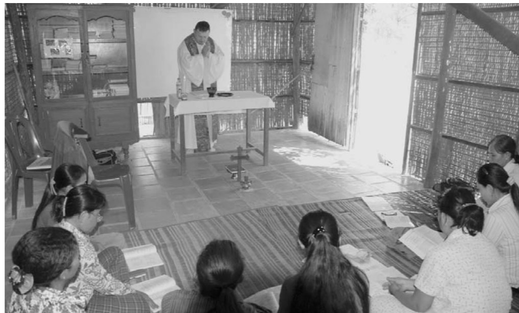
សកម្មភាពក្នុងពិធីអភិបូជា ដែលដឹកនាំលោកបូជាចារ្យ ជាមួយនិងការយកចិត្តទុកដាក់គ្រងគ្រាប់ស្នាបពិគ្រីស្ទបរិស័ទ