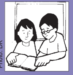
សូត្រីប្តូនៗ តើប្តូនបានប្រព្រឹត្តខ្លួន របៀបណាខ្លះដែរក្នុង រដូវអប់រំពិសេសនេះ ? ពិធីបុណ្យចម្រុះក៏ជិត

ពេលដែលព្រះយេស៊ូមានព្រះជន្មដ៏រុងរឿងបង្ហាញព្រះអង្គឱ្យក្រុមសាវ័កឃើញ ពួកគេក៏ស្ងួតញ័ររន្ធត់ចិត្តយ៉ាងខ្លាំង ព្រោះស្មានថា ជាខ្មោចលង ។ ប៉ុន្តែព្រះយេស៊ូលើកទឹកចិត្តគេ ហើយធ្វើឱ្យគេទុកចិត្តលើព្រះអង្គវិញ ។ ព្រះយេស៊ូមិនមែនជាខ្មោចទេ! ខ្មោចសុទ្ធតែធ្វើឱ្យមនុស្សភ័យរន្ធត់ តែផ្ទុយទៅវិញព្រះអង្គប្រទានសេចក្តីសុខសាន្តដល់ក្រុមសាវ័ក ។ លើសពីនេះទៅទៀតព្រះយេស៊ូពន្យល់ពួកសាវ័ក ឱ្យគេយល់ថា ពួកគេអាចស្គាល់ព្រះអង្គកាន់តែច្បាស់ឡើងៗ ប្រសិនគេចិត្តខំអានព្រះគម្ពីរ ធ្វើពិធីកាន់ចំប៉ុង និងសន្តនាជាមួយព្រះអង្គក្នុងការអធិដ្ឋានដោយចិត្តស្មោះនោះ ។